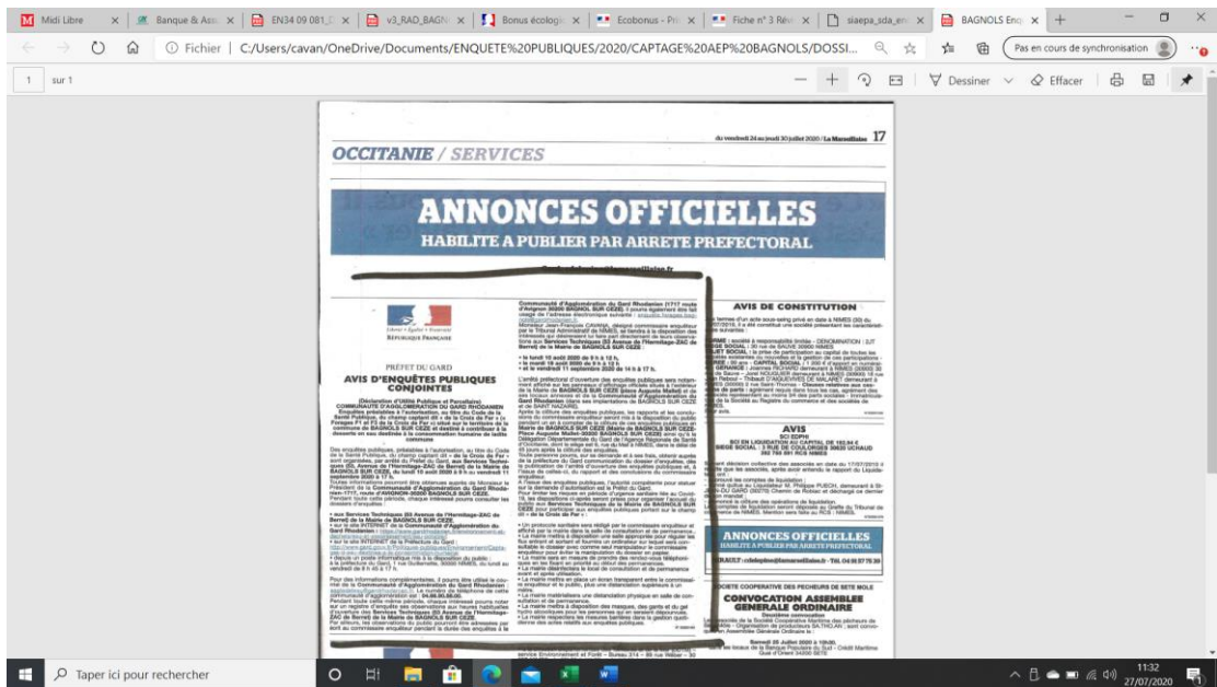
Parution avis d'enquête dans La Marseillaise du 24 au 30/07/2020